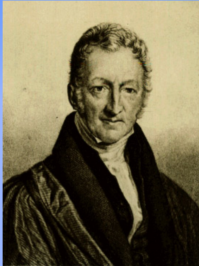
David Ricardo (1772 - 1823)